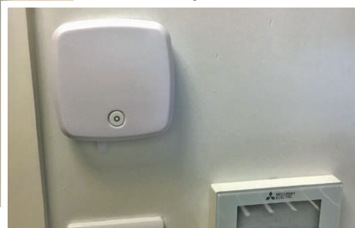
EL-MOTE logger monitort kamertemperatuur (linksboven)