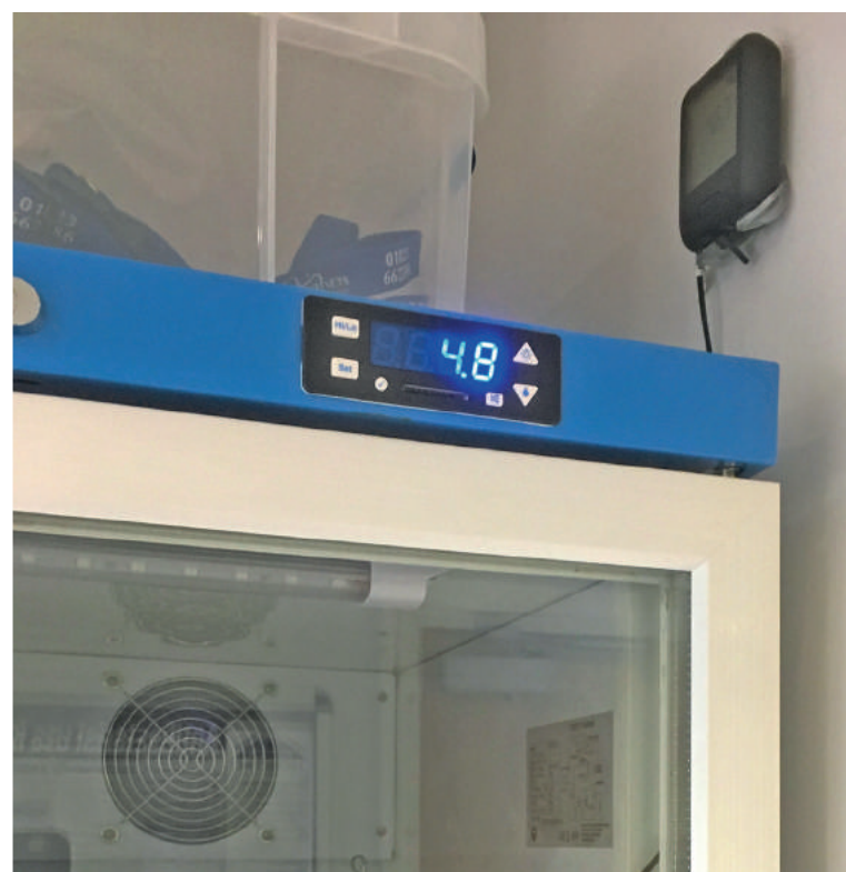
EL-WiFi-TP logger monitort koelkasttemperatuur (rechtsboven)

apparatuur nodig om medicijnkasten, koelkasten met temperatuurgevoelige medicijnen en vaccins te monitoren en om de kamer-temperatuur in operatiekamers en het ziekenhuis te bewaken. Ze kozen ervoor om de EL-WiFi-TP loggers van LogEasy te gebruiken voor hun koelkasten. Dit model heeft een externe voeler die in de koelkast kan worden geplaatst. Verder gebruiken ze de EL-MOTE serie van LogEasy voor het bewaken van hun kamertemperatuur, met een totaal van 38 data-loggers. Al deze loggers kunnen het bestaande wifi-netwerk gebruiken om hun gegevens naar een LogEasy Cloud-account te verzenden. Dit betekent dat al hun kritische temperaturen, op al hun locaties, gemakkelijk kunnen worden ge-monitord vanaf één online bedieningspaneel en dat kritieke temperatuurwaarschuwingen via e-mail worden ontvangen.